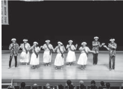
南の島のハメハメハ大王