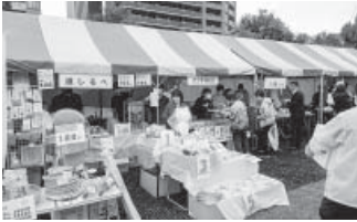
育成会関係者のお店