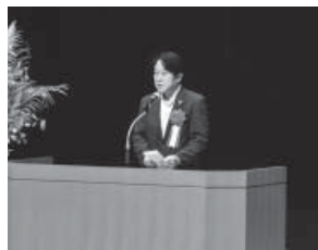
元吉県議会議長(代理)