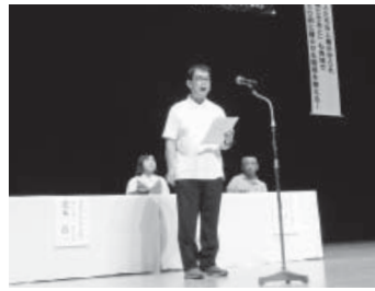
実行委員長あいさつ