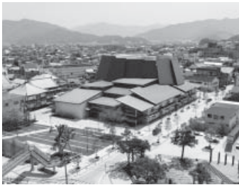
会場 さいき城山桜ホール