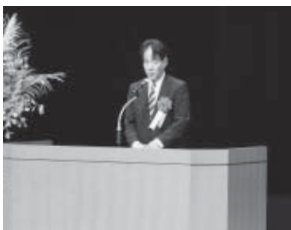
衛藤征士郎衆議院議員(代理)