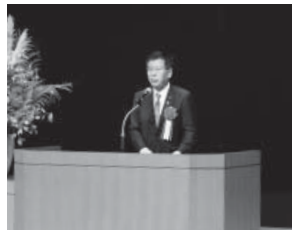
衛藤晟一顧問・参議院議員