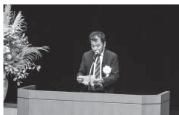
次期開催地(国東市)あいさつ