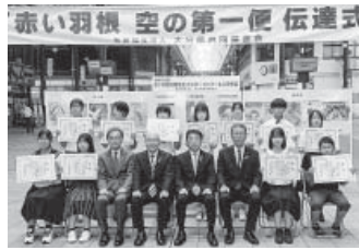
入賞者と記念写真