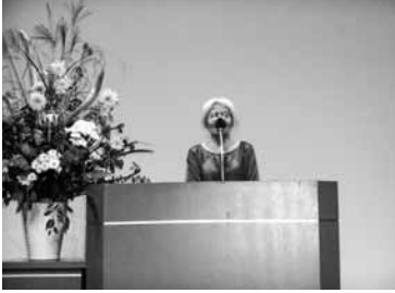
次期開催市あいさつ