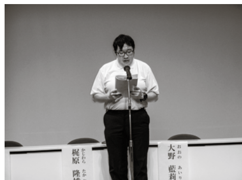
本人大会実行委員長あいさつ